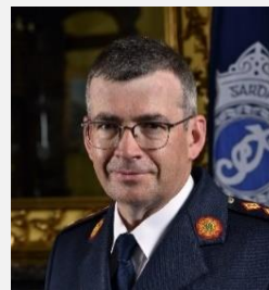
J. A. Harris An Coimisinéir, An Garda Síochána

Beagnach céad bliain ó shin, dúirt an chéad Choimisinéir Michael Staines den Gharda Síochána: “Ní éireoidh leis an nGarda Síochána le fórsa arm nó le líon mór, ach éireoidh leis de bharr a n-údarás morálta mar sheirbhísigh do na daoine.” Tá sé seo fíor i gcónaí agus faoin straitéis seo tá sé beartaithe againn ár dtiomantas do chinnteoireacht eiticíúil ar gach leibhéal a leabú tuilleadh, a bheidh struchtúir shoiléire d'fheidhmíocht mhonatóireachta agus cuntasachta mar bhonn is mar thaca aige, ag cur ar chumas ár ndaoine a thuiscint a ról maidir le daoine a choinneáil sábháilte.