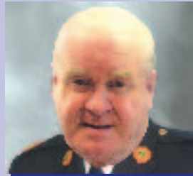
Gearóid Ó Ceallaigh Réigiún an Iarthair