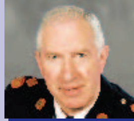
Fachtna Ó Murchú Oibríochtaí