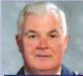
Mícheál Mac Cárthaigh Réigiún an Tuaiscirt