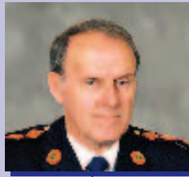
Noel Ó Conaire Coimisinéir