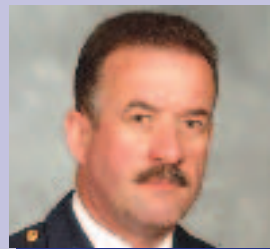
Iognáid de Raois Coireacht agus Slándáil