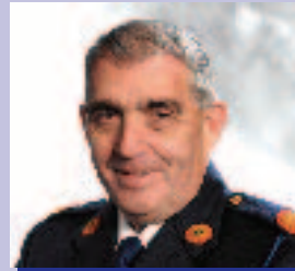
Máirtín Ó Dónalláin Réigiún an Oirdheiscirt