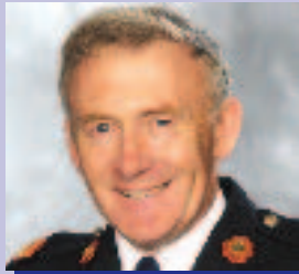
Al Mac Aodha Réigiún Cathrach Bhaile Átha Cliath