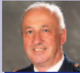
Ré Mac Aindriú Réigiún an Deiscirt