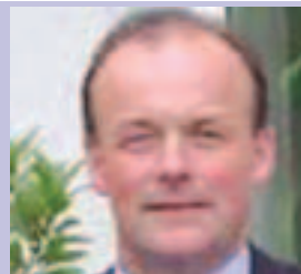
Dónal Ó Coileáin Príomhoifigeach Liachta