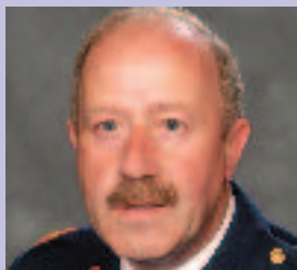
Máirtín Ó Callanáin Seirbhís Náisiúnta Tacaíochta