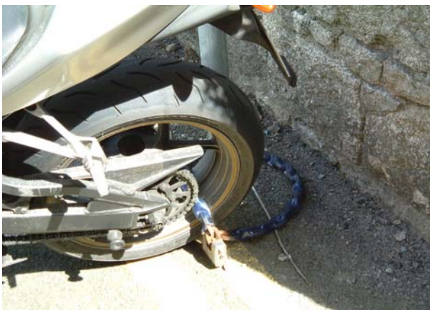
Sampla de mhodh bocht glasála – atá ina luí ar an talamh.