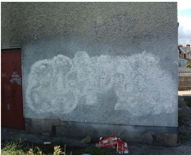
Ag clúdach spotaí – Níl sé molta.

Is í an fhoirm is fearr rialú graifítí na é a ghlanadh suas go tapaigh agus go cuí. Cuirfidh sé seo stop le stíl aithrise leathnaithe agus cuirfidh sé teorann lena ateagmhais. Léiríonn sé freisin go bhfuil úinéireacht agus rialú ar an maoin agus cuireann sé obair an loitiméara ó rath. Ní dócha go bhfillfidh oibrítheoirí graifítí ar cheantair, san áit ar chaith siad a gcuid ama agus a gcuid airgid, chun a fháil go mbíonn a gcuid oibre i gcónaí bainte anuas go sciobtha. Ba cheart an dromchla ar fad atá aghlota a bheith glanta nó péint curtha air agus ní ag clúdach spotaí ar an gceantar atá thíos leis amháin mar gheall ar gur féidir leis seo athchionta a spreagadh ag an gceantach.