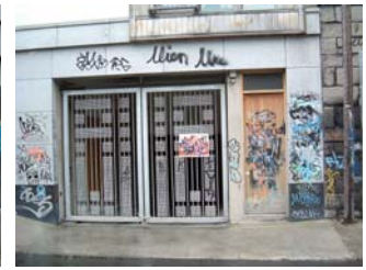
Fuinneog agus doirse aghlota