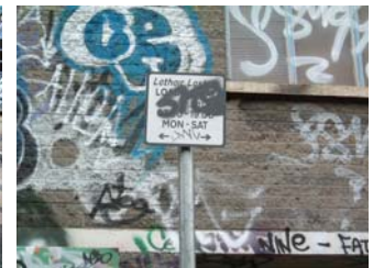
Cosán agus comhartha tráchta atá aghlota

Níl sé ar intinn an chomhairle atá sa bhileog eolais seo a bheith uileghabhálach nó iomlán.