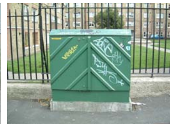
Boscaí athchúrsála agus cabinéad úsáidte atá aghlota